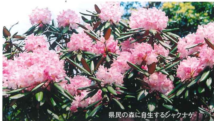
県民の森に自生するシャクナゲ