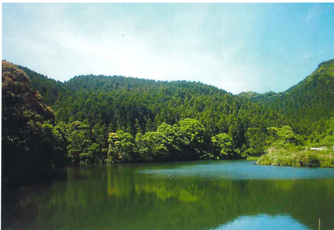
豊かな水も森林の整備から 「佐々町市ノ瀬 公社造林地」

なお、皆様方のご意見、ご感想をお寄せいただき、今後の参考にしたいと思っておりますのでよろしくお願い申し上げます。